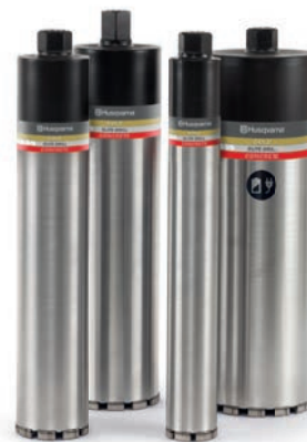
ELITE, VARI & TACTI-CUT DRILL