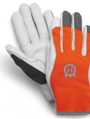
GANTS, CLASSIC LIGHT 579 38 00-09