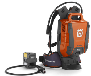
HUSQVARNA BLI950X 967 09 32-01