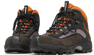
BOTTES DE PROTECTION TECHNICAL 575 35 47-37