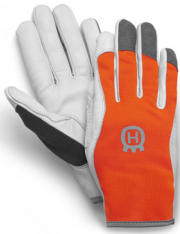
GANTS, CLASSIC LIGHT 596 31 06-07