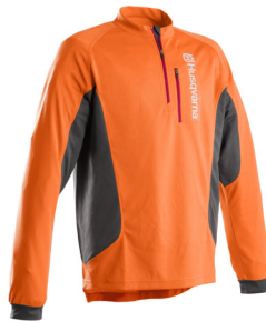
WORK T-SHIRT LONG SLEEVE, TECHNICAL 501 72 03-54