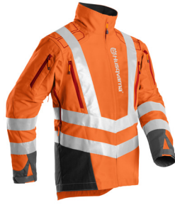
BRUSHCUTTING- AND TRIMMER JACKET, HIGH VIZ 597 24 59-58