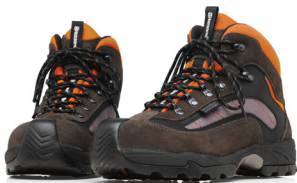
BOTTES DE PROTECTION TECHNICAL 596 30 64-45