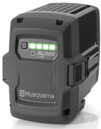
HUSQVARNA BATTERY BLI300 967 07 19-01