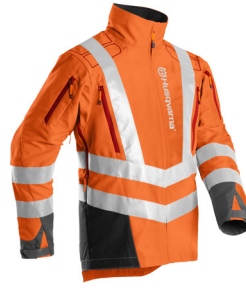
BRUSHCUTTING- AND TRIMMER JACKET, HIGH VIZ 597 24 59-62