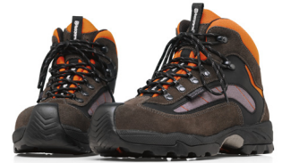
BOTTES DE PROTECTION TECHNICAL 596 30 64-44