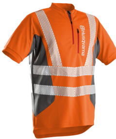
WORK T-SHIRT HIGH VIZ, TECHNICAL 596 30 39-50