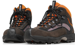
BOTTES DE PROTECTION TECHNICAL 575 35 47-46