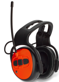
PROTECTION OREILLES AVEC RADIO FM 578 27 49-03