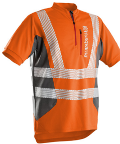
WORK T-SHIRT HIGH VIZ, TECHNICAL 501 72 05-58