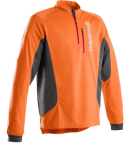
WORK T-SHIRT LONG SLEEVE, TECHNICAL 501 72 03-46