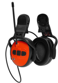
PROTECTION OREILLES AVEC RADIO FM 578 27 49-04