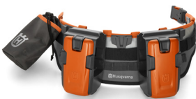
HUSQVARNA BATTERY BELT FLEXI 590 77 67-01