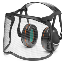
[AU] EARSUFFS WITH NET VISOR 505 66 53-61