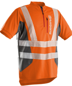
WORK T-SHIRT HIGH VIZ, TECHNICAL 501 72 05-54