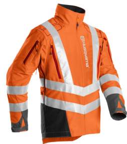
BRUSHCUTTING- AND TRIMMER JACKET, HIGH VIZ 597 24 59-50