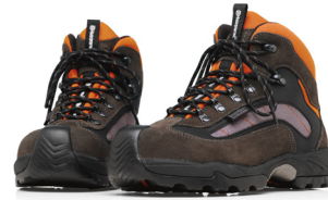
BOTTES DE PROTECTION TECHNICAL 596 30 64-39