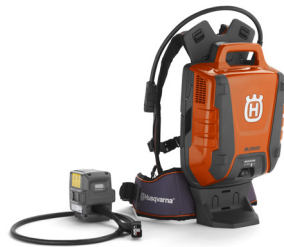
HUSQVARNA BLI550X 967 09 31-01