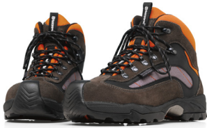
BOTTES DE PROTECTION TECHNICAL 596 30 64-37