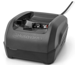
HUSQVARNA CHARGER QC250 967 97 01-01