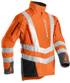
BRUSHCUTTING- AND TRIMMER JACKET, HIGH VIZ 597 24 59-54