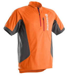
WORK T-SHIRT SHORT SLEEVE, TECHNICAL 501 71 59-54