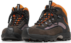
BOTTES DE PROTECTION TECHNICAL 575 35 47-45