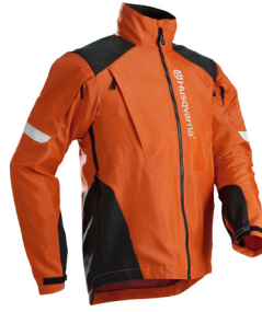
VESTE POUR TURBOFILS ET DÉBROUSSAILLEUSES, TECHNICAL 580 68 82-46