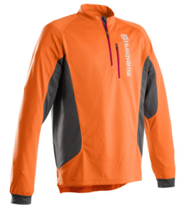
WORK T-SHIRT LONG SLEEVE, TECHNICAL 501 72 03-62