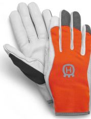
GANTS, CLASSIC LIGHT 596 31 06-08