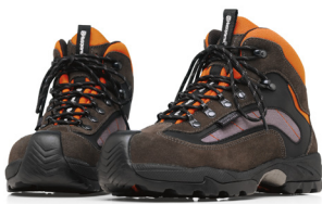
BOTTES DE PROTECTION TECHNICAL 575 35 47-41