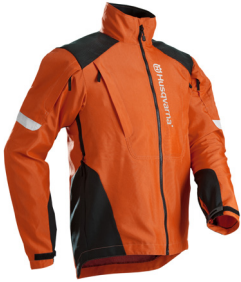
VESTE POUR TURBOFILS ET DÉBROUSSAILLEUSES, TECHNICAL 580 68 82-54