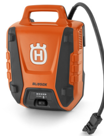
HUSQVARNA BLI950X 579 82 22-01