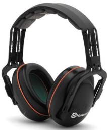
PROTECTEUR D'OREILLES, SERRE-TÊTE 505 66 53-04