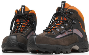
BOTTES DE PROTECTION TECHNICAL 596 30 64-41