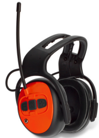
PROTECTION OREILLES AVEC RADIO FM 578 27 49-01