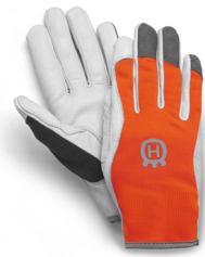
GANTS, CLASSIC LIGHT 596 31 06-06