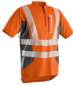
WORK T-SHIRT HIGH VIZ, TECHNICAL 596 30 39-66