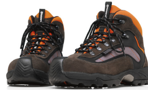
BOTTES DE PROTECTION TECHNICAL 596 30 64-43