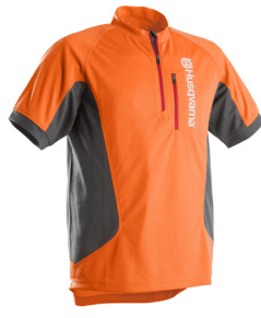
MODÈLE COURT TECHNICAL 501 71 59-46