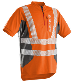
WORK T-SHIRT HIGH VIZ, TECHNICAL 501 72 05-66