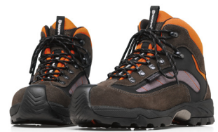
BOTTES DE PROTECTION TECHNICAL 575 35 47-44