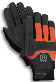
GANTS, TECHNICAL LIGHT 596 30 92-09