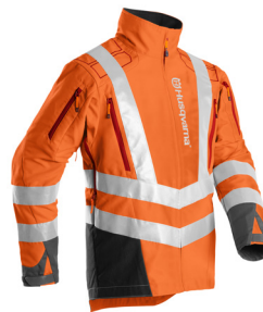
BRUSHCUTTING- AND TRIMMER JACKET, HIGH VIZ 597 24 59-46