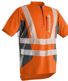
WORK T-SHIRT HIGH VIZ, TECHNICAL 501 72 05-62