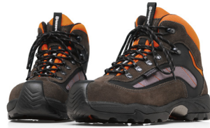
BOTTES DE PROTECTION TECHNICAL 596 30 64-38