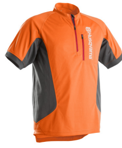
WORK T-SHIRT SHORT SLEEVE, TECHNICAL 501 71 59-50