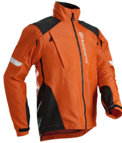
VESTE POUR TURBOFILS ET DÉBROUSSAILLEUSES, TECHNICAL 580 68 82-62