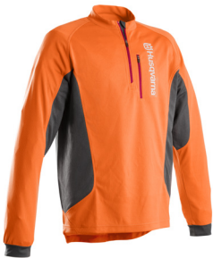
WORK T-SHIRT LONG SLEEVE, TECHNICAL 501 72 03-50