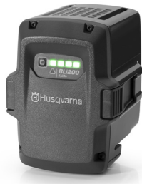
HUSQVARNA BATTERY BLI200 967 09 19-01