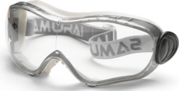
MASQUE DE PROTECTION 544 96 39-01