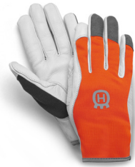
GANTS, CLASSIC LIGHT 596 31 06-10