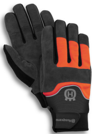
GANTS, TECHNICAL LIGHT 596 30 92-08