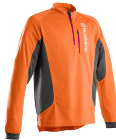
WORK T-SHIRT LONG SLEEVE, TECHNICAL 501 72 03-58