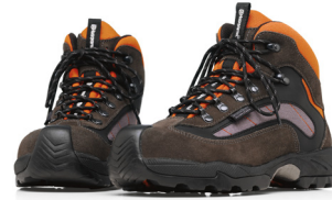
BOTTES DE PROTECTION TECHNICAL 575 35 47-47