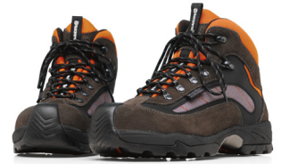
BOTTES DE PROTECTION TECHNICAL 596 30 64-40