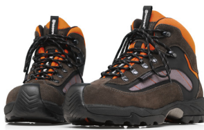
BOTTES DE PROTECTION TECHNICAL 575 35 47-43