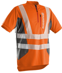
WORK T-SHIRT HIGH VIZ, TECHNICAL 596 30 39-62