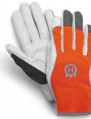
GANTS, CLASSIC LIGHT 596 31 06-09