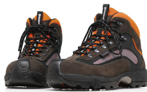
BOTTES DE PROTECTION TECHNICAL 575 35 47-42