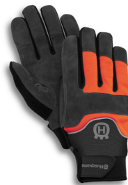
GANTS, TECHNICAL LIGHT 596 30 92-10