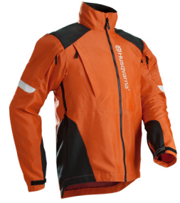
VESTE POUR TURBOFILS ET DÉBROUSSAILLEUSES, TECHNICAL 580 68 82-50