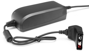
HUSQVARNA CHARGER QC80 967 33 56-31