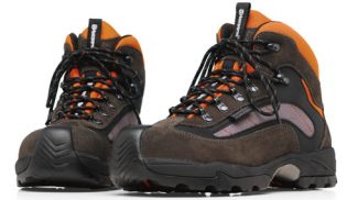
BOTTES DE PROTECTION TECHNICAL 596 30 64-36