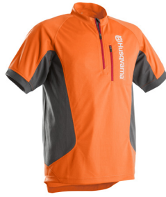
WORK T-SHIRT SHORT SLEEVE, TECHNICAL 501 71 59-62