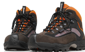
BOTTES DE PROTECTION TECHNICAL 596 30 64-47