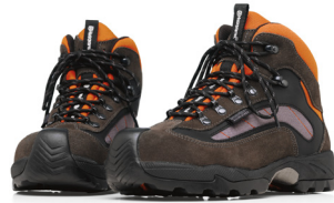
BOTTES DE PROTECTION TECHNICAL 596 30 64-42