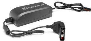
HUSQVARNA CHARGER QC500 967 09 15-01