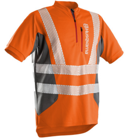
WORK T-SHIRT HIGH VIZ, TECHNICAL 501 72 05-46