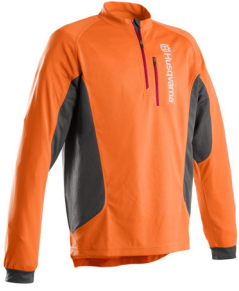
WORK T-SHIRT LONG SLEEVE, TECHNICAL 501 72 03-66