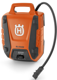
HUSQVARNA BLI550X 579 82 44-01