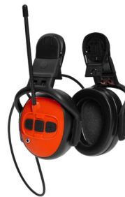
PROTECTION OREILLES AVEC RADIO FM 578 27 49-02