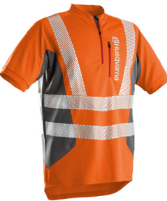
WORK T-SHIRT HIGH VIZ, TECHNICAL 596 30 39-46