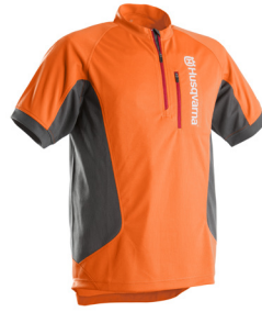
WORK T-SHIRT SHORT SLEEVE, TECHNICAL 501 71 59-66