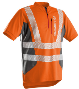
WORK T-SHIRT HIGH VIZ, TECHNICAL 596 30 39-58