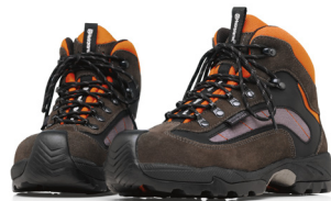
BOTTES DE PROTECTION TECHNICAL 596 30 64-46