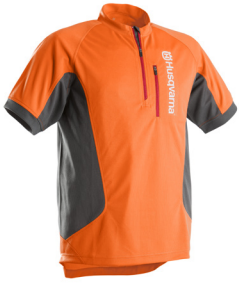
WORK T-SHIRT SHORT SLEEVE, TECHNICAL 501 71 59-58