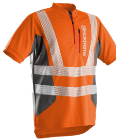
WORK T-SHIRT HIGH VIZ, TECHNICAL 596 30 39-54