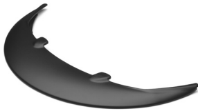
PROTECTION SOLAIRE POUR VISIÈRE 578 17 98-01